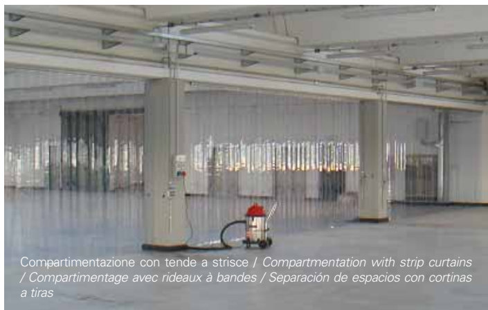
Compartimentazione con tende a strisce / Compartmentation with strip curtains / Compartimentage avec rideaux à bandes / Separación de espacios con cortinas a tiras