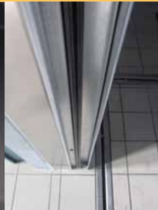
Particolare guida verticale Detail of vertical track Détail rail vertical Detalle carril vertical de salida